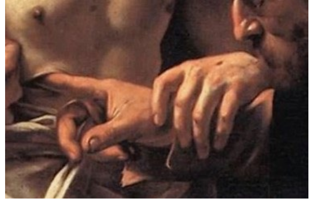
Raffronto tra la mano di Gesù e quella di San Tommaso

Gesù sono affusolate e pulite, quelle di Tommaso tozze e sporche. Nessuno è escluso da Dio, soprattutto quelli “sporchi”, cioè i peccatori.